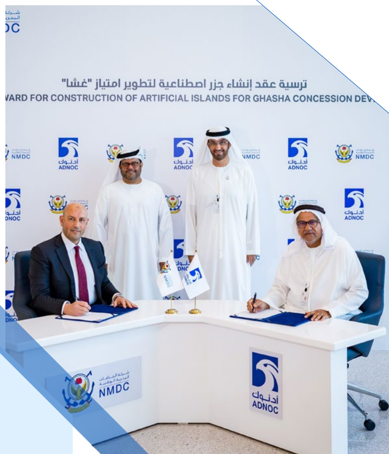
توقيع اتفاقية إنشاء جزر هيل وغشا الصناعية

في الختام، نحن نعمل في بيئة اقتصادية مليئة بالشكوك. لا يمكن التأكد من التأثير الكامل لمسألة فيروس كورونا، كما لا يمكن كذلك التأكد إلى أي مدى يمكن للتدابير التحفيزية التي أعلنتها الحكومات في جميع أنحاء العالم معالجة هذا التأثير. وبالتالي، حيث حققت مجموعتكم مرة أخرى أداءً مالياً قوياً في عام ٢٠١٩، لا تزال تتطلب هذه الأوضاع غير المستقرة حالياً نهجاً حذراً تجاه المستقبل.