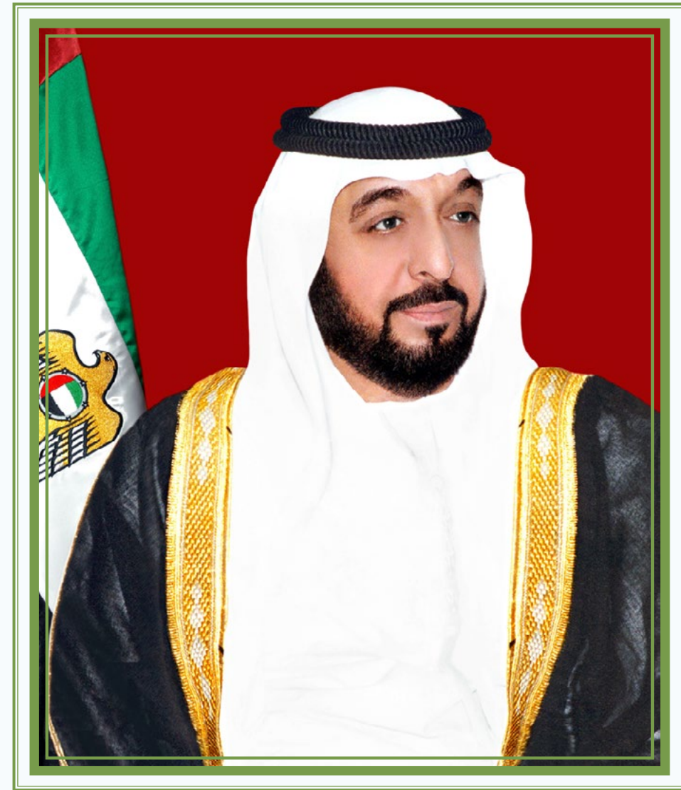
صاحب السمو الشيخ خليفة بن زايد آل نهيان

ولي عهد أبوظبي، نائب القائد الأعلى للقوات المسلحة، رئيس المجلس التنفيذي