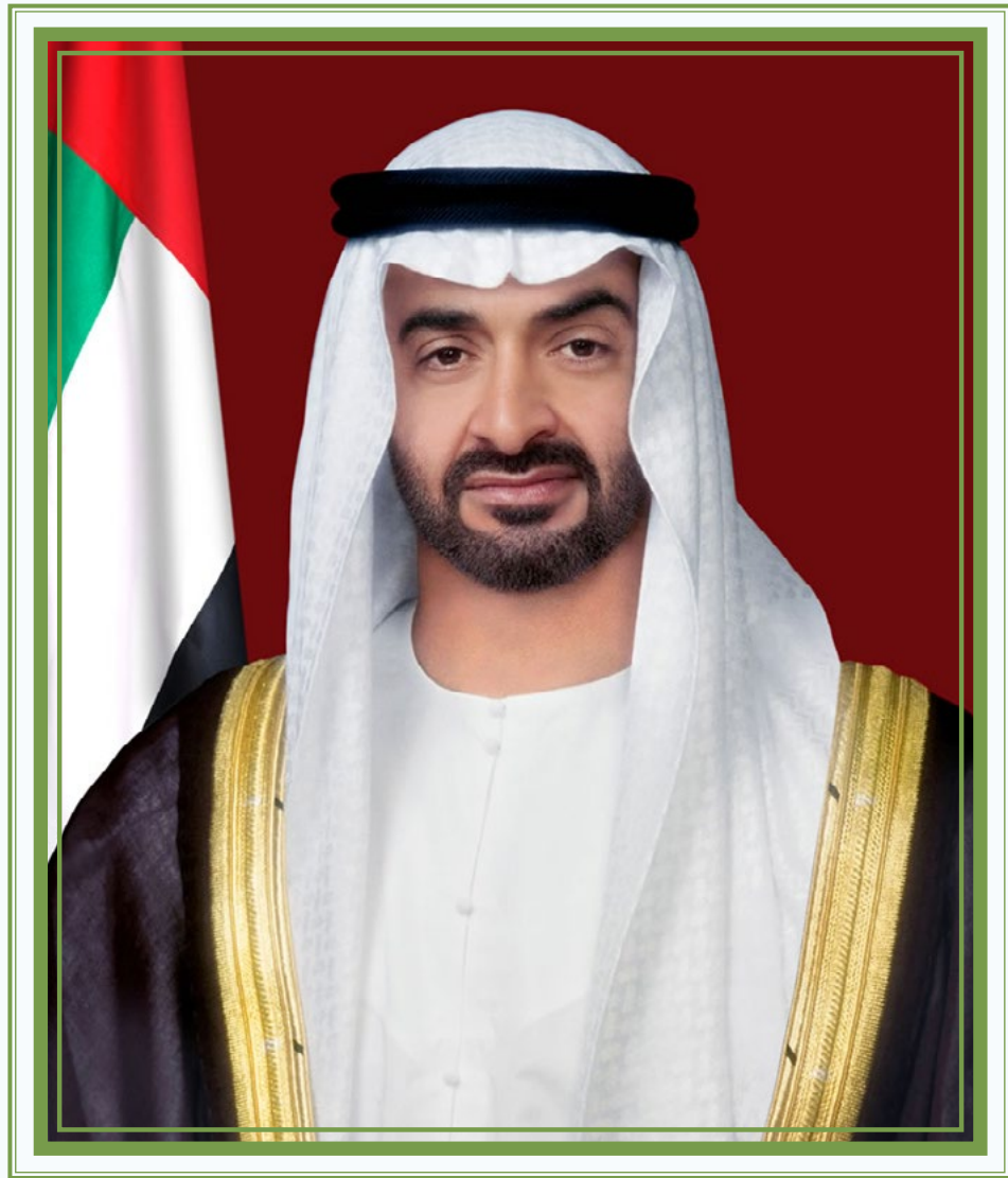
صاحب السمو الشيخ محمد بن زايد آل نهيان

ولي عهد أبوظبي، نائب القائد الأعلى للقوات المسلحة، رئيس المجلس التنفيذي